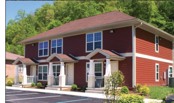
Foto superior: Una sobreviviente y sus hijos pequeños se relajan en el porche del campus de Green House17 en Lexington.

Foto del medio: Seis familias viven en apartamentos construidos en la base de una colina de los Apalaches en DOVES, en Morehead.