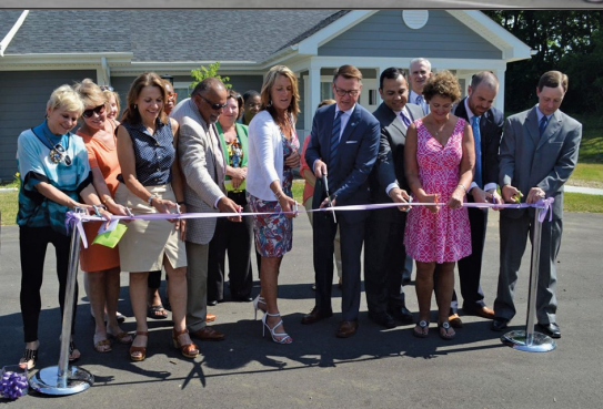
Foto superior: Las personas sobrevivientes remitidas por Merryman House en Paducah se trasladaron a 12 unidades en otoño de 2011.

Foto del medio: Este edificio de apartamentos de cuatro pisos y 22 unidades se encuentra frente al Centro para Mujeres y Familias, cerca del centro de Louisville.